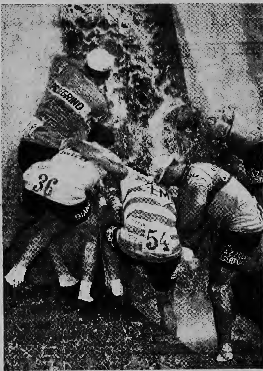
RONDE DI ITALIA. — Di seis etappe dje ronde di Italia, Palermo-Milazzo; e corredonon tabatin aqui masha molester di calor. N' ta nada strano cu un waterval na camina a ser invadi.

(Di nos redactor deportivo) Directiva di ATTA cu algun siman pasa a ricibi un invitacion for di Barranquilla, Colombia pa bai participa den e Segundo Campeonato Internacional di Pingpong, a acepta e invitacion. Pa cubri e gastonan envolvi di directiva di ATTA lo haci un peticion cerca directiva di ASU. Lo bai competi dos hungador junior y tres senior. E campeonato lo worde teni den luna di augustus na Barranquilla.